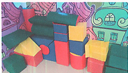
Мягкие игровые модули