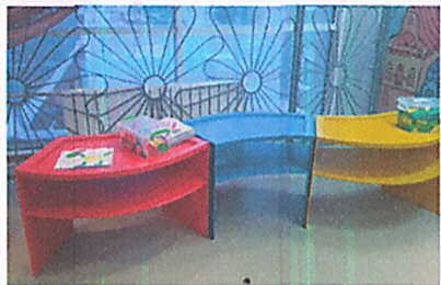
Многофункциональный стол «Ручеек»