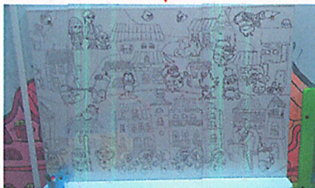
Панель для «позитивного» рисования